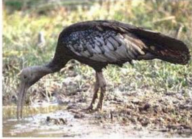
សត្វត្រយ៉ង