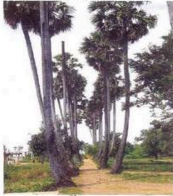
ដើមត្នោត