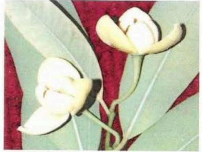
ផ្ការំដួល