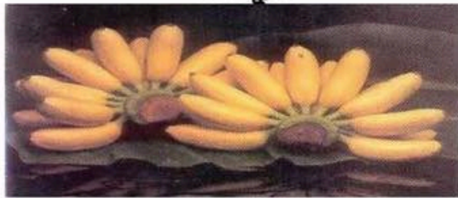
ផ្លែចេកពងមាន់