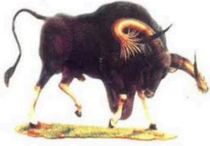
សត្វគោព្រៃ