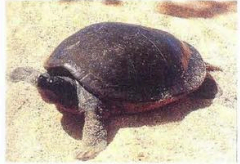
អណ្តើកសរសៃ(អណ្តើកហ្លួង)